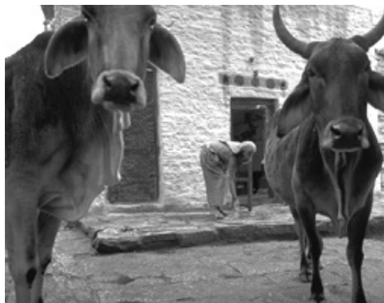
Cualquier parecido es pura coincidencia

Todo un rebaño de vacuas ideologías babeando sobre vosotros; toda una manada de mentirosos conceptos vertiendo su estiércol chirle entre vosotros; toda una mugiente impedimenta retrasando vuestra marcha hacia el pan de cada día. ¡No más rumiantes! ¡No más falsarios de la razón! ¡Sólo hombres! ¡Sólo nuestra condición hasta ahora contradicha! ¡Acusa! ¡Acusa la audiencia!